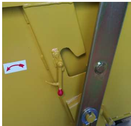
SISTEMA ANTI-QUEDA ACIDENTAL